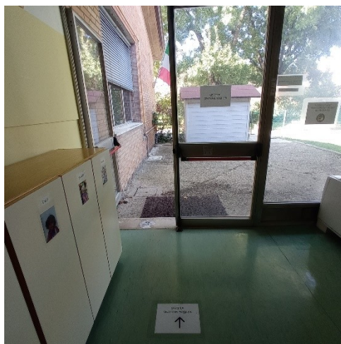
Uscita sezione FOGLIE

La sezione FOGLIE esce passando dal “giardino delle erbe odorose”