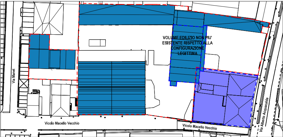
PLANIMETRIA STATO LEGITTIMO Scala 1:500

NOTA : Consideriamo come stato legittimo gli elaborati della tavola 1 "Analisi stato di fatto" del Progetto di Riqualificazione Urbana RURc n.6: Area Ex consorzio Agrario, Via Acquacalda e Vicolo Macello approvato da delibera di C.C. n. 52 del 20/04/2009