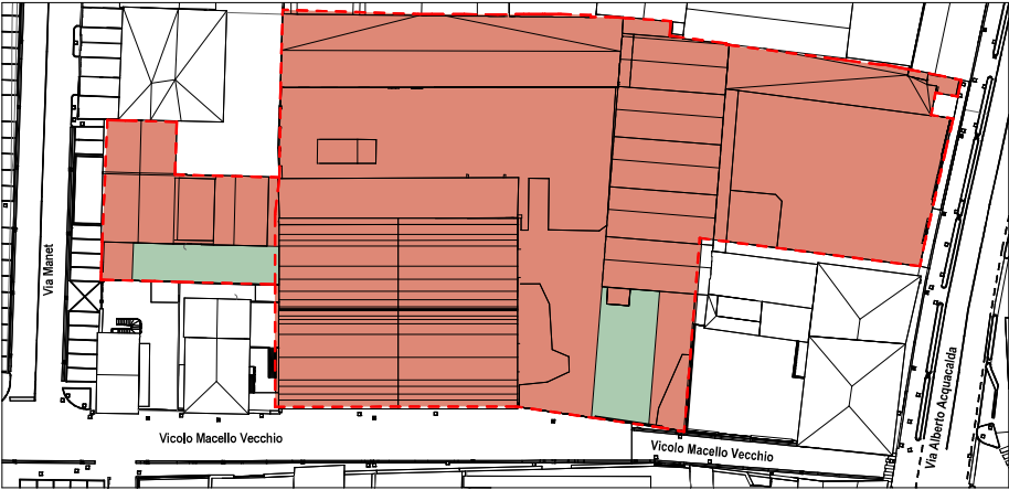
STATO PERMEABILITA' DEL SUOLO STATO LEGITTIMO Scala 1:500